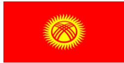
Ղրղզստանի Հանրապետության հաշվիչ պալատ