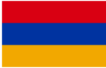
Հայաստանի Հանրապետության հաշվեքննիչ պալատ