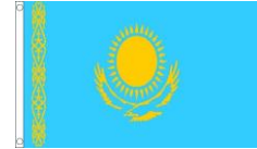
Ղազախստանի Հանրապետության հանրապետական բյուջեի կատարման նկատմամբ վերահսկողության հարցերով հաշվիչ կոմիտե