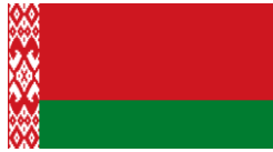
Բելառուսի Հանրապետության պետական վերահսկողության կոմիտե